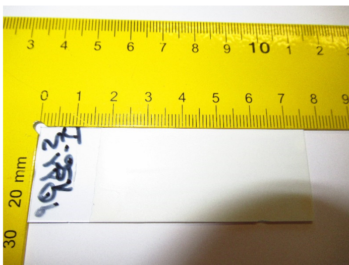
Abbildung 1: Prüfkörper